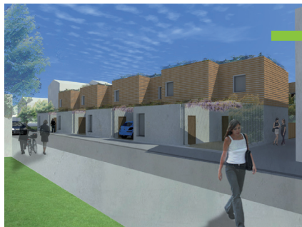
Cabinet d'architecture : Rolph MATZ

Les Florentines Rue des Cinq piquets à NANCY Constructeur : LE NID T 4 Surface : 89 m 2 Label T.H.P.E.*