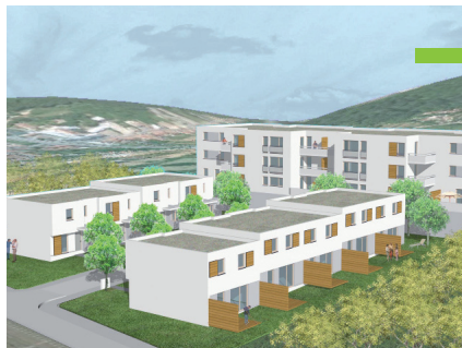
Cabinet d'architecture : SCP Rabolini et Schlegel

Les Florentines : Rue François Guinet à NANCY Constructeur : LE NID T 5 Surface 95 m 2 Label T.H.P.E.*