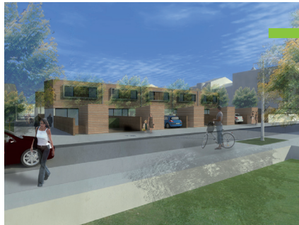
Cabinet d'architecture : Rolph MATZ

Les Florentines Rue des Cinq piquets à NANCY Constructeur : LE NID T 4 Surface : 89 m 2 Label T.H.P.E.*