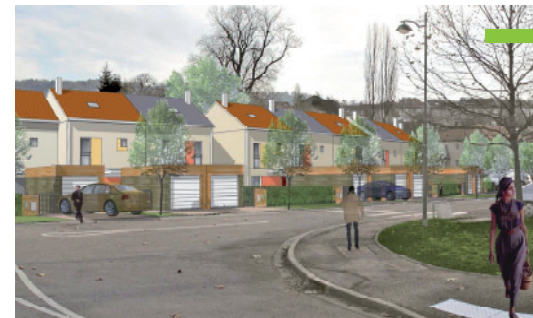
Cabinet d'architecture : Mallot/ATTB

Le Hameau de Victor Rue des Cinq piquets à NANCY Constructeur : MAISON FAMILIALE LORRAINE T4 + Surface : 105 m 2 Label T.H.P.E.*