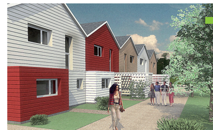
IMOHTEP architecture – Agence Jean KRIER

Rue de la République à PULNOY Constructeur : LORRAINE VOSGES HABITAT T4 + Surface : 93 m 2 Label T.H.P.E.*