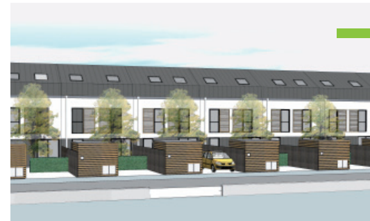
Cabinet d'architecture : Rolph MATZ

Le Clos des Hérissons : Rue Gambetta à MAXEVILLE Constructeur : LE NID T 4 Surface 87 m 2 Label T.H.P.E.*