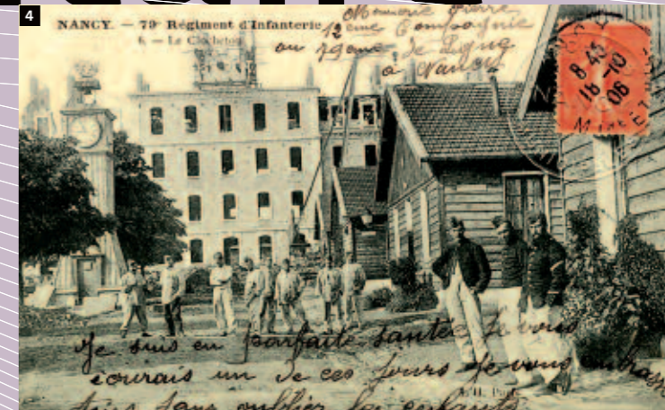
1 Caserne Landremont (aujourd'hui caserne Verneau), sans date

de Nancy ou en 1946 après la Seconde Guerre mondiale. Occupées par l'armée allemande dès 1940, les casernes sont bombardées le 15 septembre 1944, quelques jours avant la libération de Nancy. Puis, jusqu'en 1998, date de leur fermeture, elles accueillent plus tranquillement des générations de "trouffions".